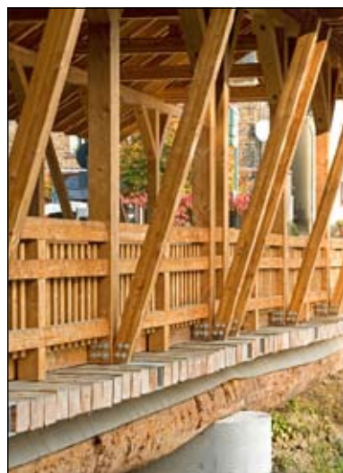
Bäume entziehen beim Wachstum der Atmosphäre Kohlenstoff, der im Holz gespeichert wird.