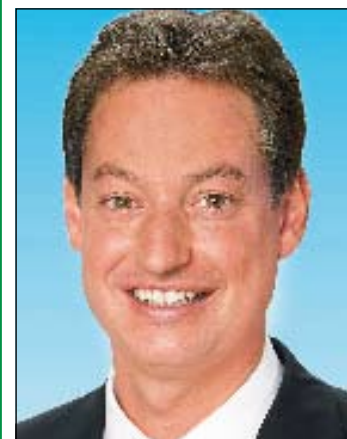
Markus Pannermayr , Oberbürgermeister, Stadt Straubing

Ich danke den Messeveranstaltern für die Vorbereitung und Organisation. Ich bin sicher, dass diese Fachmesse auf große Resonanz stoßen wird. In diesem Sinne wünsche ich der „biomasse 2009“ viel Erfolg und allen Gästen – Ausstellern und Besuchern – einen angenehmen Aufenthalt in Straubing.